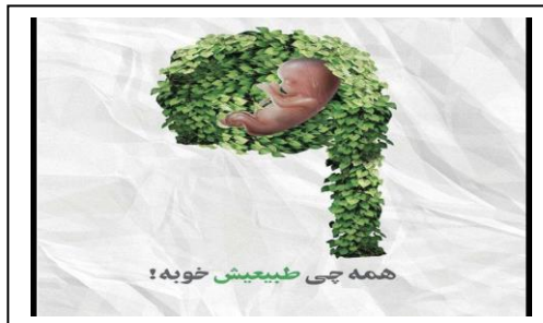
اتاقهای تک نفره زایمان بیمارستان الزهرا (س)